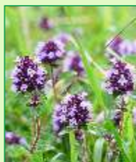
Gemeiner Thymian

Weiter entfernt vom Weg (Fernglas) kann im Hochsommer im Bereich des Lambziggrundes der seit dem Mittelalter geschätzte Heilziest (Arznei-Betonie) bestaunt werden.