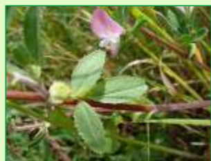
Kriechender Hauhechel

Vorbei am Großen und Kleinen Weidenteich wird das NSG erreicht und es eröffnet sich der Blick auf die offene Heide-landschaft. Auffällige Silikatfelskuppen aus vulkanischem Diabas prägen die Hütellandschaft. Überall entlang der Wegstrecke sind zu sehen: Kriechender Hauhechel, Gemeiner Thymian, Wiesenflockenblume, Heide-Nelke, Stengellose Kratzdistel und als wertvolle Arzneipflanze das Johanniskraut.